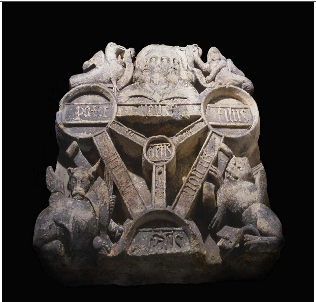
Trinité et Tétramorphe Sculpture J.Espagnet (c) Mairie de Bordeaux,

Voici la photo Officielle et les mentions légales :